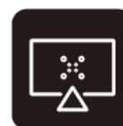
От VESA 400 до 600/700/800 мм